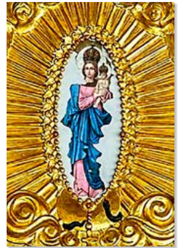
Zreštaurovaný obraz Panny Márie s Ježiškom