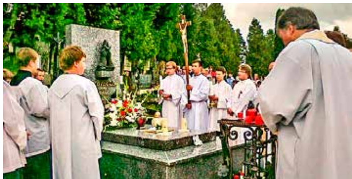
Spomienková slávnosť pri 49. výročí úmrtia biskupa Vojtaššáka