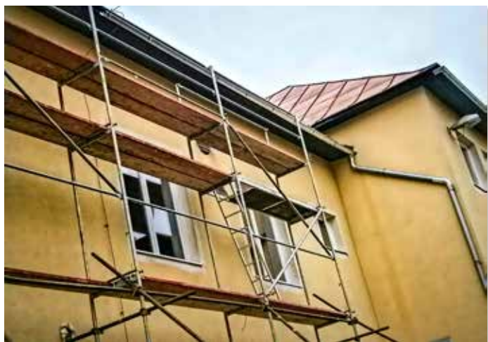
Inštalácia nových dažďových zvodov na dome kultúry a pošty