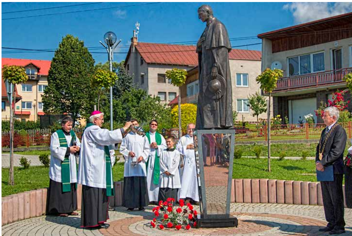
Požehnanie sochy nášho najväčšieho rodáka, biskupa Jána Vojtaššáka