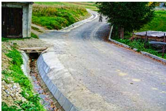
Hlboká cesta pred a po prácach