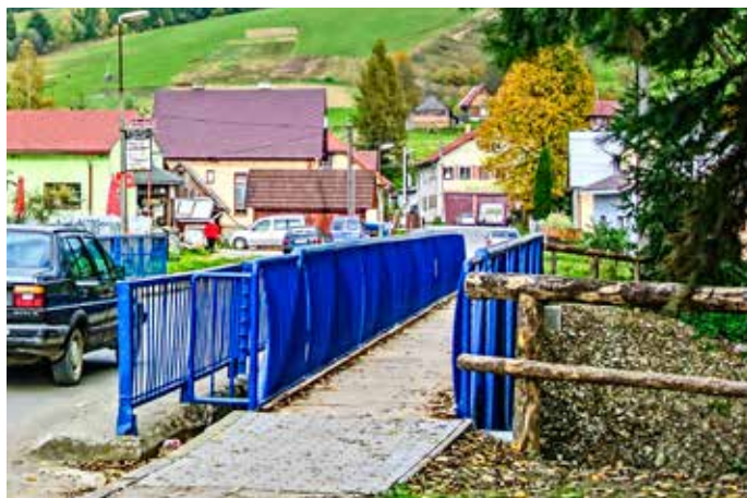
Občanom slúži bezpečná lavička

Po zhodnotení plnenia rozpočtu nadviazal s informáciou o zmene rozpočtu. Bežné dennodenné fungovanie obce si vyžaduje zmenu v rozpočte presunom po položkách. Došlo aj k navýšeniu a to dotáciami zo štátu napr. pre asistentov učiteľov, odchodné do dôchodku učiteľov, na učebné pomôcky znevýhodneným žiakom, dotácia na matriku na ná-