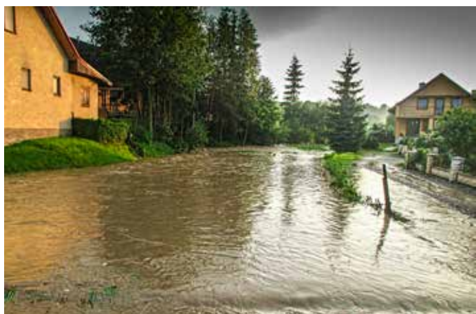
Rok 2014 by si zaslúžil aj prívlastok rok dažďov Vydatné zrážky trápili veľa našich občanov