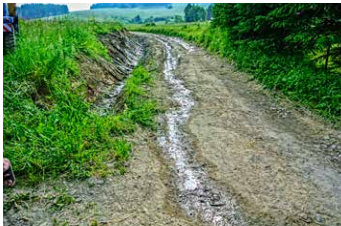
Hlboká cesta pred prácami

Starosta stručne oboznámil poslancov so zmenou rozpočtu k 30. 5. 2014. Podrobný prehľad je v tabuľke, ktorú mali poslanci k dispozícii. Obec dostala dotáciu z ÚPSVaRu, robili sa úpravy na Hlbokkej ceste – navýšenie kanálu, zakúpil sa nový softvér na obecný úrad, zakúpila sa kosačka. Poslanci jednomyselne zmenu rozpočtu k 30. 5. 2014 schválili v počte 10 hlasov.