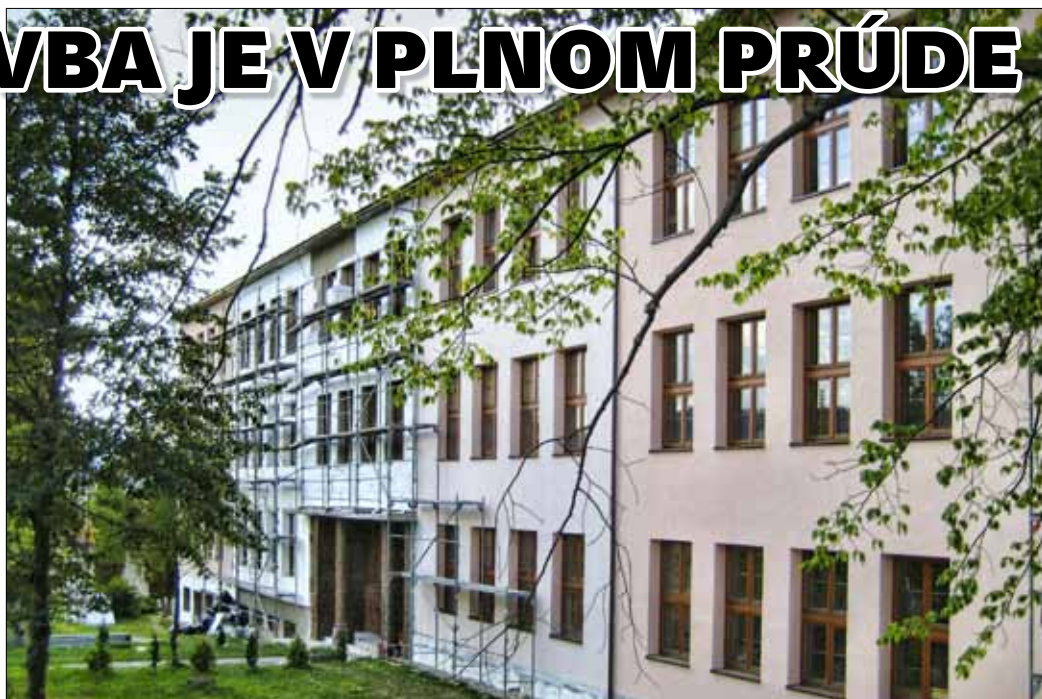
Zateplovanie starej školy

Čo všetko sa v rámci prestavby urobí? Všetky budovy sa zateplia, urobí sa nová fasáda. Zateplia sa všetky stropy vo všetkých budovách. V MŠ v Oraviciach sa okrem toho urobí rekonštrukcia elektroinštalácie, urobí sa nové elektrické vykurovanie budovy. V starej školskej budove sa komplet vymenia rozvody ústredného kúrenia a nainštalujú sa nové vykurovacie telesá. V novej školskej budove sa vymenia staré vykurovacie telesá za nové. V budove školskej jedálne sa vymenia všetky okná. V telocvični okrem zateplenia strechy sa vymení parketová podlaha za pľubovku. V budove školských dielní sa urobí nadstavba, kde sa vybudujú tri odborné učebne s kabinetmi a sociálnymi zariadeniami. Okrem týchto stavebných prác sa