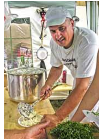
Varenie halušiek I. ročník e-FOTO Mgr. Marta Šalátová