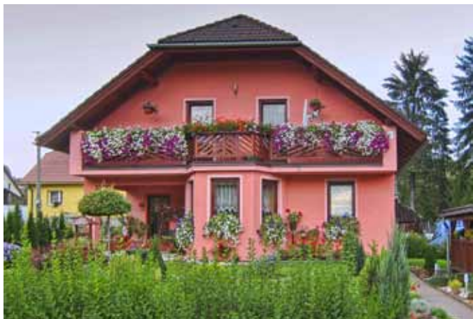
Jeseň na balkóne