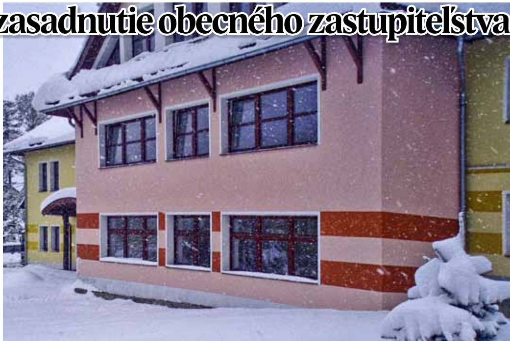
15. október Nový Dom kultúry pred dokončením počas nečakanej snehovej fujavice

Obecné zastupiteľstvo (OZ) schválilo zmenu v programe a to z toho dôvodu, že na minulom zasadnutí nebol riaditeľ školy prítomný, takže so správou o činnosti, vystúpil hneď na úvod. Riaditeľ informoval OZ o prácach, ktoré prebiehajú na škole v rámci rekonštrukcie realizovanej na základe dotácie z európskych fondov. Interiér starej školskej budovy je hotový, vonkajšie práce budú pokračovať ešte aj cez školský rok. V novej školskej budove sa ešte pracuje, ale začiatok školského roka to neovplyvní, začne sa vyučovať načas. Personálne je škola vybavená na 100 %, to znamená, že všetky predmety vyučujú kvalifikovaní učitelia. Záujem o vyučovanie anglického jazyka je aj v materskej škole. Vedenie školy sa vynasnaží zrealizovať ho. Problémy začínajú byť s te-