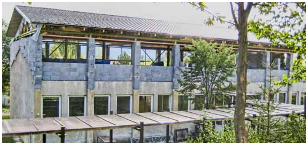
Nadstavba školských dielní