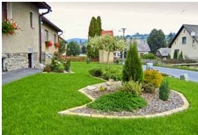
Jeseň v záhradke