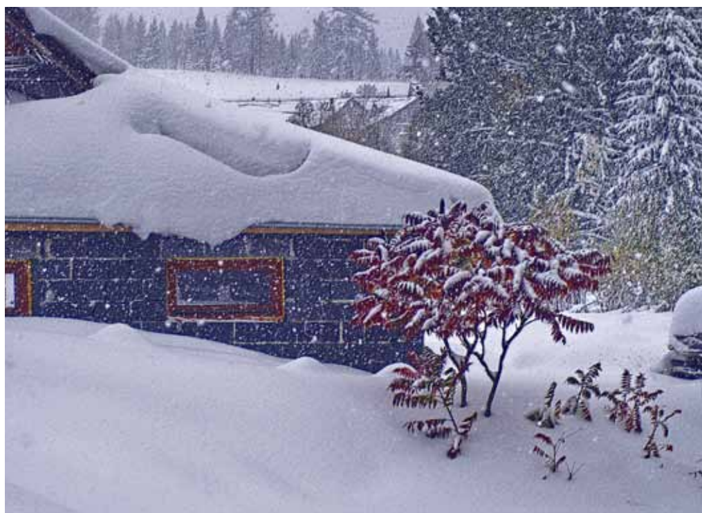
15. október 2009 Biela vrstva mokrého snehu prekvapila všetkých, aj stromy ešte s listím

www.zakamenne.sk pod názvom Šport/Tenisový turnaj 2009.