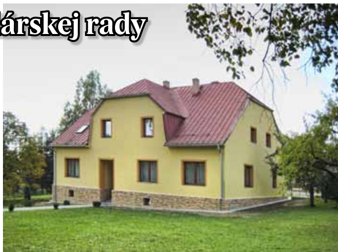
Nový vzhľad farskej budovy