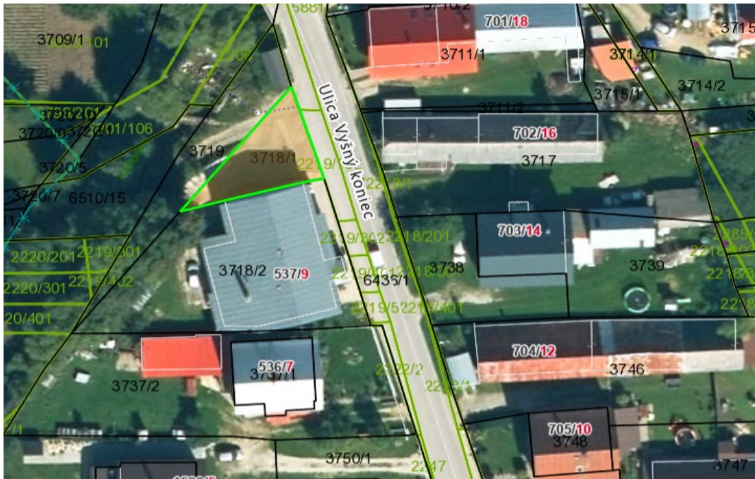
Trhové miesto na ambulantly predaj pri obchode Coop Jednota Vyšný koniec