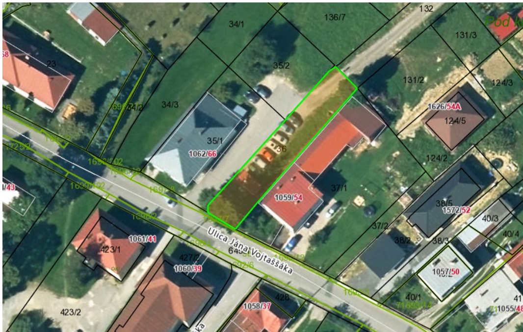
Trhové miesto na ambulantom predaj pri obchode Coop Jednota Ústredie