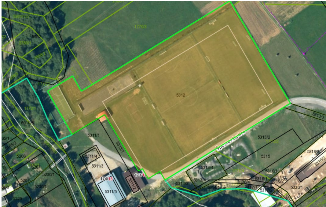
Trhové miesto na ambulantný predaj v priestoroch športového areálu v Oraviciach