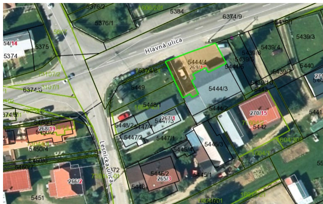
Trhové miesto na ambulantom predaj pri obchode Coop Jednota Oravice