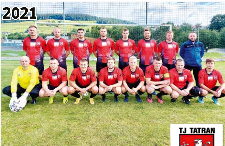
Zákamenský futbal - Muži