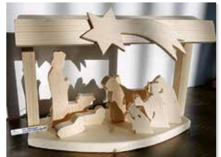
Betlehem č. 4 – 1. miesto

návštevou, obdarovali balíčkami plnými dobrôt a drobností. Potešili aj spoločenskými hrami, relaxačnými maľovankami, krížovkami a teplými ponožkami.