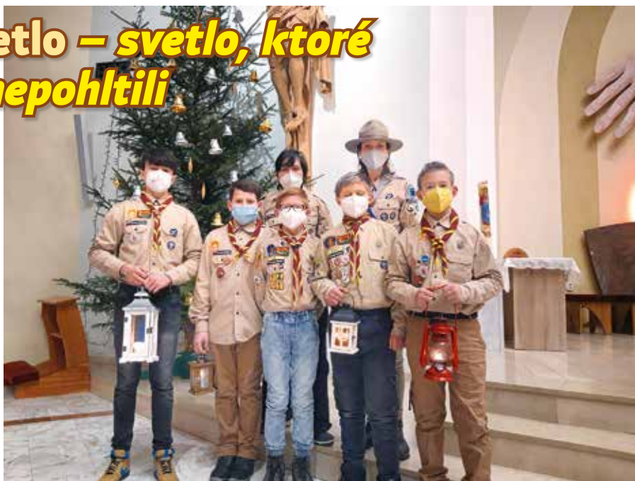
Betlehemské svetlo – Kostol sv. Jozefa, 24. 12. 2021

Aj tento rok členovia Slovenského skautingu rozniesli svetlo pokoja a radosti do všetkých kútov Slovenka.