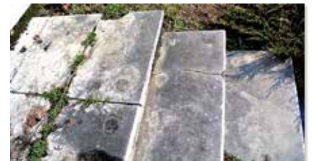
Schody k pamätníku pred opravou

Obec Zákamenné podala na Úrad vlády SR žiadosť o dotáciu na obnovu pamätníka v obci.