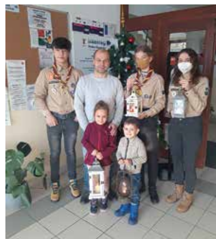
Betlehemské svetlo OcÚ Zákamenné 23. 12. 2021