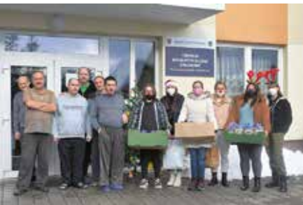
Darčeky od študentiek zo Súkromnej spojenej školy – EDUCO

a obdarovali aj prijímateľov v zariadení sociálnych služieb Zákamenné.