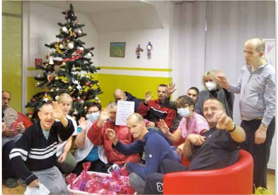
Darčeky od Obce Zákamenné

Tento rok bol pre našich prijímateľov naozaj bohatý na darčeky a prekvapenia od nezištných ľudí. Dôkazom toho boli aj študentky zo Súkromnej Spojenej školy EDUCO. Našich prijímateľov v Zákamennom potešili milou