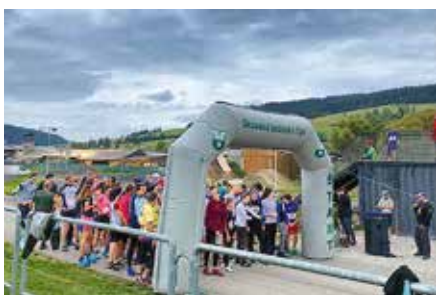
Beh na Štibel

sa s mnohými ďalšími jazdcami – to by mohla byť dobrá motivácia prísť. Všetci ste vrelo vítaní.