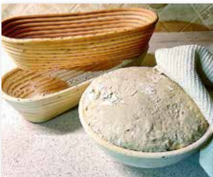
Vykvasené cesto v ošatke