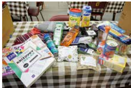
Darčeky od Charity

návštevou, obdarovali balíčkami plnými dobrôt a drobností. Potešili aj spoločenskými hrami, relaxačnými maľovankami, krížovkami a teplými ponožkami.