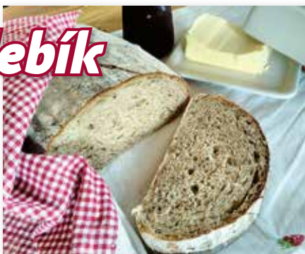
Kváskový chlebík v reze

Kuchyňou sa šíri krásna domáca vôňa. Neustále kontrolujem cez okienko na sporáku produkt môjho snaženia. Rodina sa netrpezlivo pýta, kedy to už bude hotové. Za hodinu už ochutnávame guľatý bochník. Prežívam víťazoslávny pocit: „Dokázala som to!“. Môj prvý domáci chlieb. A navyše kváskový.