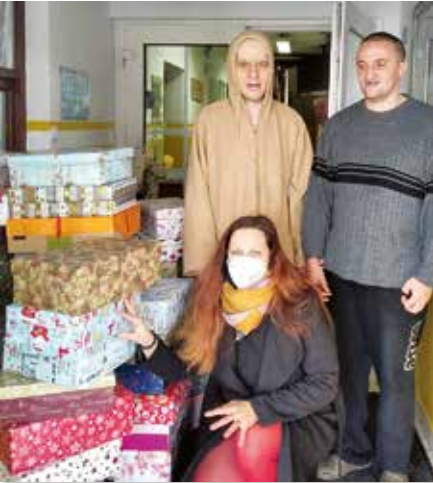
Kolko lásky sa zmestí do krabice od topánok