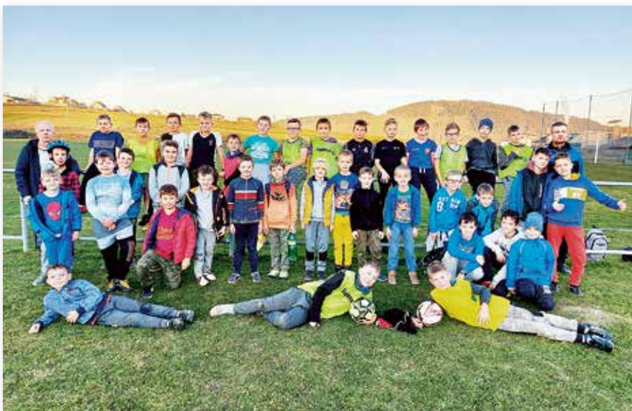
Zákamenská futbalová mládež