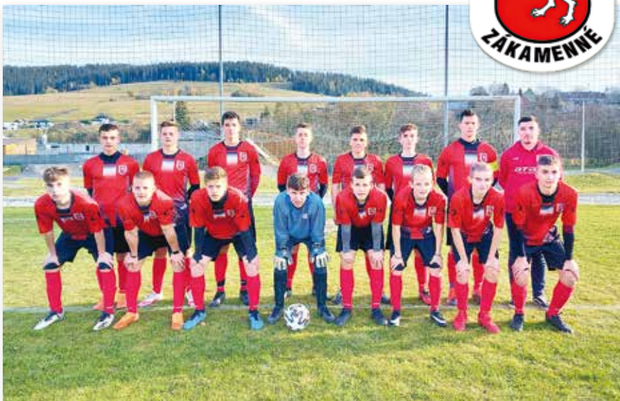
Zákamenská futbalová mládež - Dorast