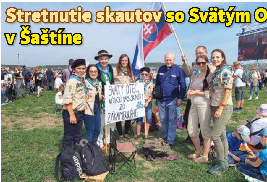
Skauti - puť Šaštín s riaditeľom rádia Proglas, 15. 9. 2021

15. 9. 2021 Príchod Sv. Otca Františka bola pre nás významnou udalosťou a to z dôvodu, že je hlavou katolíckej Cirkvi a v mnohých veciach nám skautom podobný a blízky srdcu.