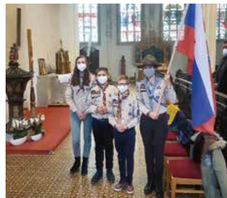
Výročie otca biskupa na Spiši, 14. 11. 2021