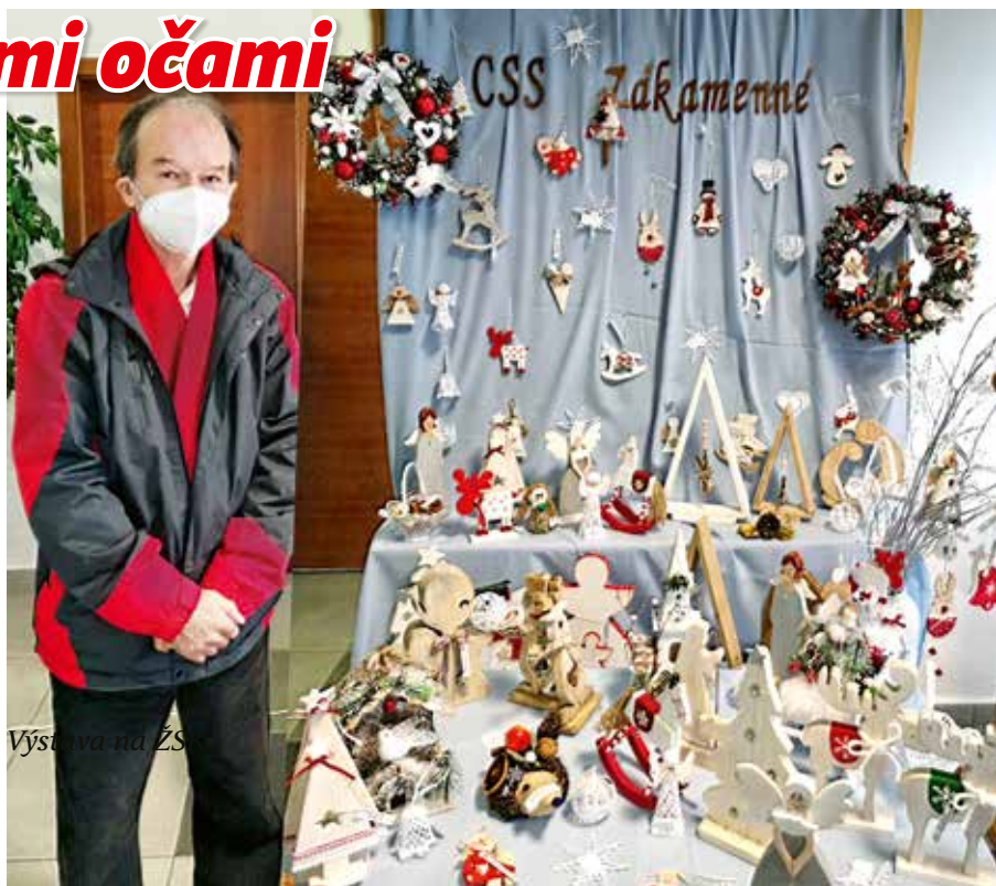
Výstava na ŽS

V decembri nám boli na pracovisku CSS v Zákamennom odovzdané balíčky z projektu s nádhernou myšlienkou