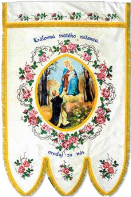
Obrázok Kráľovnej svätého ruženca