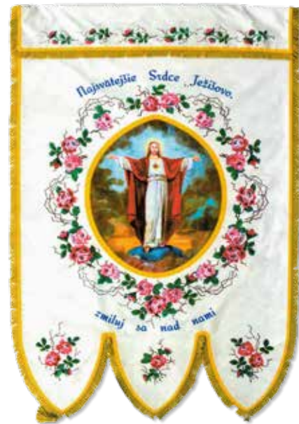
Obrázok najsvätejšieho srdca Ježišovo

Aj naši predkovia mali vo veľkej úcte Pannu Máriu a vždy sa k nej utie-