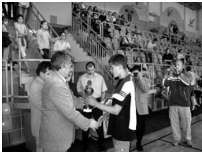
Starosta obce Zákamenné počas odovzdávania ceny za najlepšie výsledky v jednotlivých súťažiach