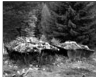
Takto preplnené kontajnery umiestnené medzi cintorínmi, čakajú týždne na svoje vyprázdnenie

kat na najbližší väčší sviatok, alebo odpust. Veď za tieto a s tým spojené služby platia všetci občania Zákamenného. mariániglar