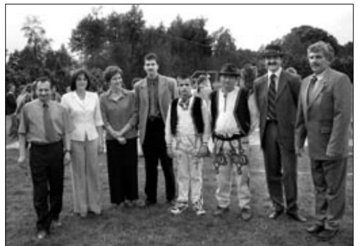
Prvá medzinárodná olympiáda mládeže

Pre spomienkovú fotografiu zapožovali predstavitelia samosprávy, školstva a kultúry družobných obcí