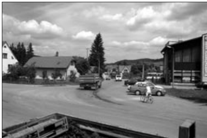
Aj táto frekventovaná križovatka je nebezpečná pre chodcov a vodičov pre chýbajúce vodorovné dopravné značenie. Kedy bude jasné, kde je krajnica vozovky, kde je chodník a parkovacie miesto, alebo zastávka autobusu?