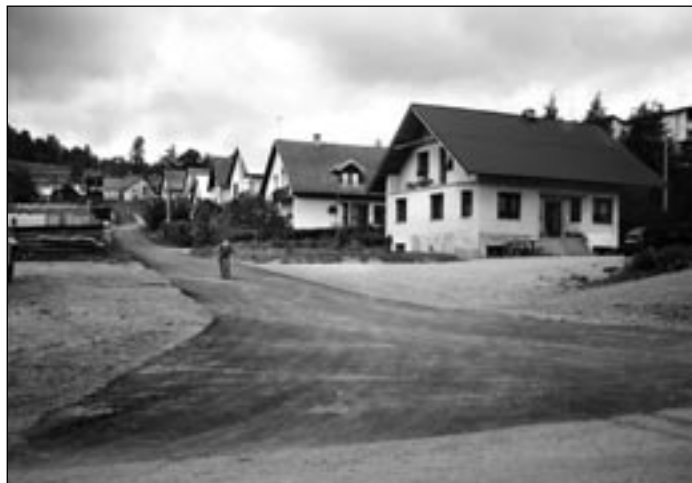
„Ešte tam bývate krátko, aby ste mali riadnu cestu“: tak, tento výrok už neplatí – a novému asfaltovému povrchu sa určite potešili občania ulice v časti Špitál

Starosta informoval poslancov o akciách, ktoré prebehli od ostatného zasadnutia. Dobudovala sa cesta na Kalváriu s príspevním sumy 350 tis. Sk z rezervy vlády SR, zrekonštruovala sa miestna komunikácia k individuálnej bytovej výstavbe, obvodné zdravotné stredisko v hodnote 430 tis. Sk, asfaltujú sa chodníky prepájajúce školské budovy – 240 tis. Sk, buduje sa cesta k futbalovému ihrisku, dokončuje sa rekonštrukcia budovy starého obecného úradu, uskutočnil sa prevod energetických stavieb v obci do majetku SSE, z dôvodu vrátenia finančných prostriedkov, ktoré obec preinvestovala do týchto stavieb – ide o čiastku 2 100 000 Sk. Zakúpil sa traktor – 282 tis. Sk, nainštalovala