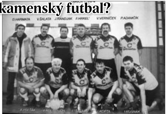
Vítazi futbalovej miniligy Zákamenné 2003/2004

Možno by bolo dobré, keby sa pred začiatkom súťaže zišli za jedným stolom funkcionári TJ, vede-