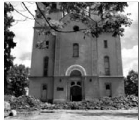
Takto momentálne vyzerá priestor pred farským kostolom, kde sa prevádzajú rôzne stavebné práce úpravy priestranstva