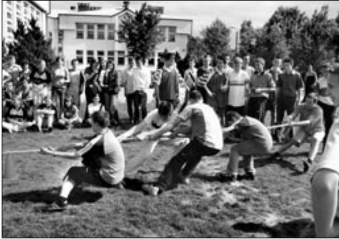
Prvá medzinárodná olympiáda mládeže

Takto honosne nazvali športový deň, ktorého sa zúčastnili reprezentanti škôl Zákamenné a Novot, zmerajúc si sily s Poľskou družobnou školou. Pozrime sa priebeh tohto podujatia očami jednej z účastníčok.