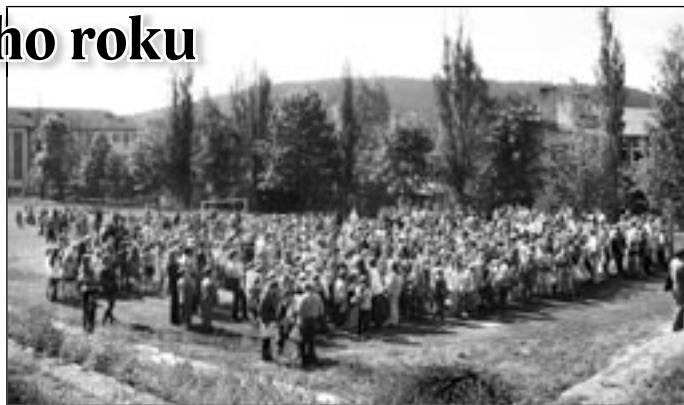
Tak – a je tu koniec školského roku 2003/2004