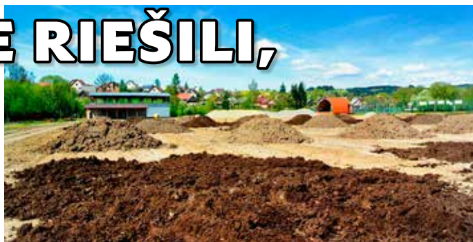
Práce na ihrisku

Upravený štatút obce bol poslancom zaslaný e-mailovou poštou. Jedným z opatrení na odstránenie nedostatkov zistených kontrolou NKÚ SR je aktualizácia interných právnych predpisov, jed-