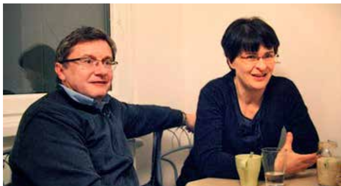
Dodo a Simona Predáčovci

Do tejto kampane sme sa v Zákamennom zapojili už piatykrát, tentokrát ako spoločenstvo ôsmich rodín. Program sme rozvrhli do dvoch dní s úplne odlišnou náplňou.