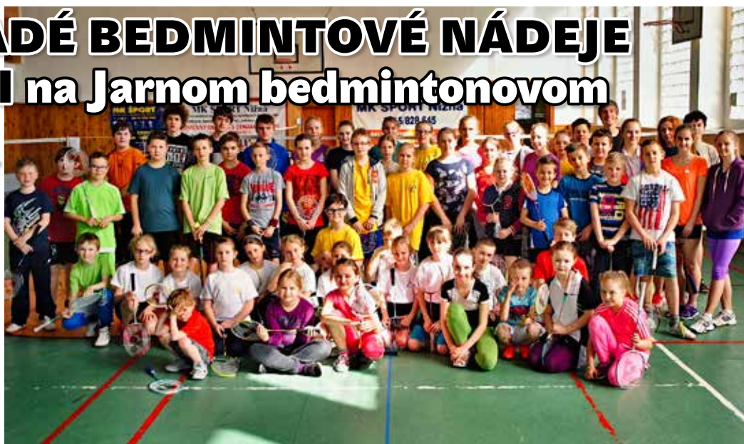
Účastníci Jarného bedmintonového turnaja v Nižnej 17. 4. 2016