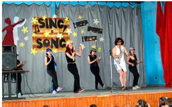
Nedali sa zahanbiť ani učители