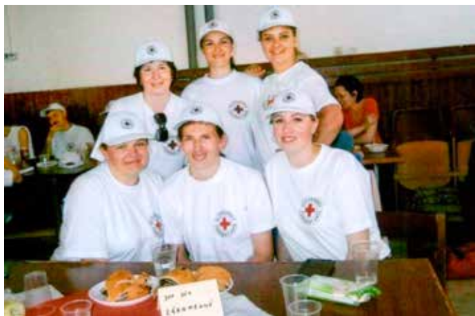
Družstvo prvej pomoci

Veľkým prelomom v histórii bol objav krvného obehu už v roku 1616. O päťdesiat rokov neskôr prebehla prvá transfúzia zvierat, kde lekári spojili krčné tepny dvoch psov. Prvá úspešná transfúzia sa konala v roku 1667, kedy J. B. Denis lekár kráľa Ludovíta XIV. použil krv jahňata a striebornou rúrkou ju dostal do žíl mladého muža trpiaceho letargiou a zimni-