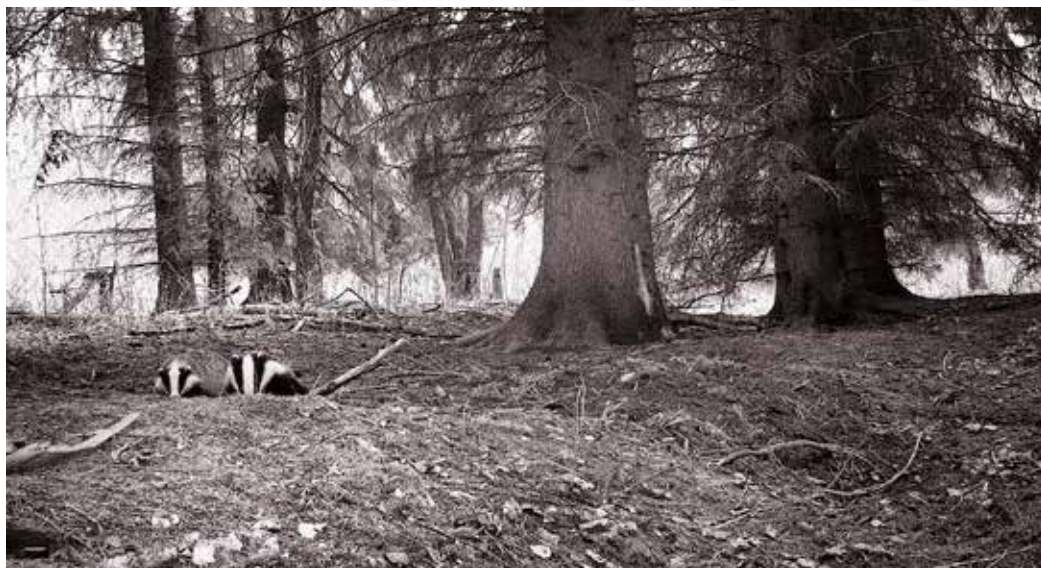
Jazvece v časti „Grúň“

Môj starý otec hovorieval: „...na Gregora idú lady do mora.“ Gregora, teda 12 marca, je dávno za nami a jar je v plnom prúde. Príroda je v stave plného rozvoja, živočíchy a rastliny sa snažia využiť jej tohtoročný skorý príchod.