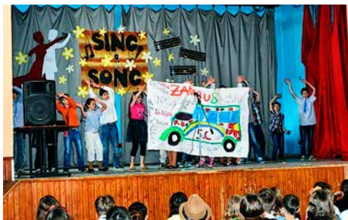
Trieda 5. C sa doviezla na autobuse ZAKABus

Dňa 6. 5 sa v starom KD uskutočnil 4. ročník súťaže v speve zahraničných piesní, ktorý organizuje naša ZŠ pod vedením učiteľov cudzích jazykov.