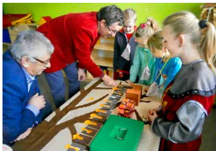
Lúškačikovci lúštia Lúškačika – prizierajú sa starosta s riaditeľom školy