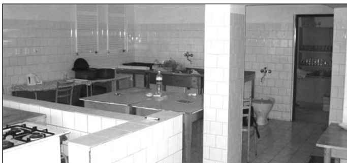
Nová kuchynka v kultúrnom dome kompletne rekonštruovaná

Na Vyšnom konci pri obecných vodojemoch bola vykonaná obhliadka miesta, pre následné posúdenie možnosti výstavby ihriska. Riešenie neulahčuje fakt, že pozemok patrí do katastrálneho územia obce Novof. (šfr)