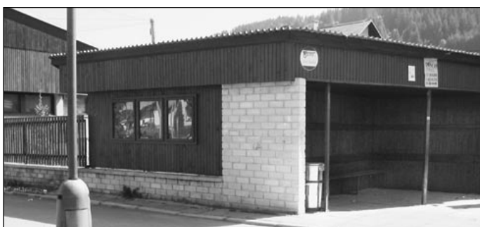
Nová autobusová zastávka a dole tak vyzerá stará;