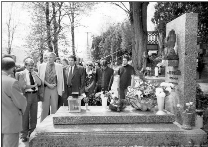
Predseda vlády SR Mikuláš Dzurinda so sprievodom navštívil v máji 2003 hrob vdp. biskupa Jána Vojtaššáka