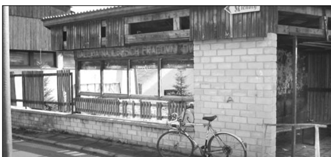
Stará autobusová zastávka; dole: rozšírená cesta okolo kostola