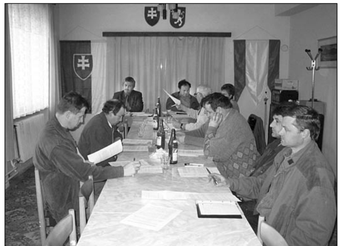
25. 4. 2002 Zasadnutie obecného zastupiteľstva